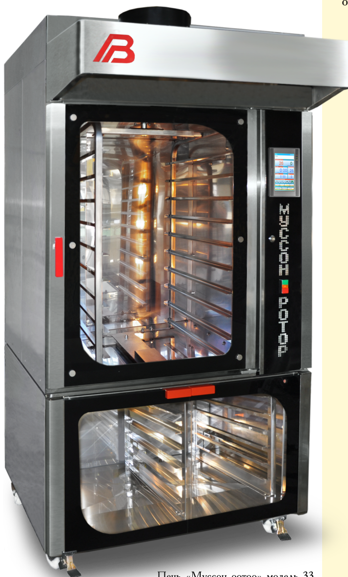
Печь «Муссон-ротатор» модель 33 и расстойный шкаф «Бриз» модель 33