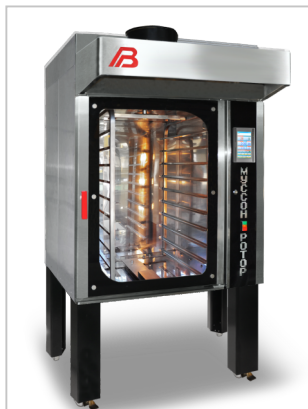
Печь «Муссон-ротатор» модель 33 на опорах